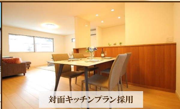
対面キッチンプラン採用