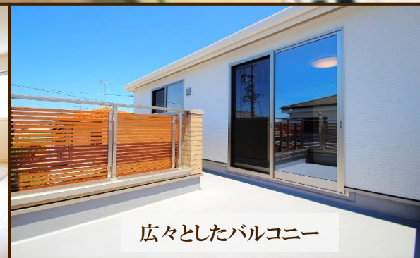
広々としたバルコニー