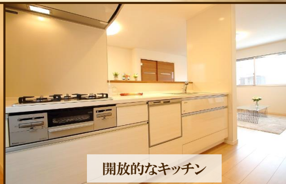
開放的なキッチン